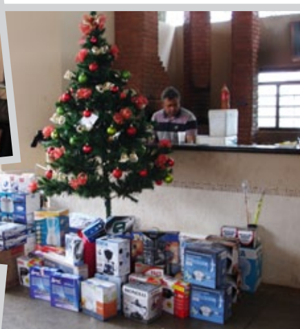
Confraternização em Bilac/SP