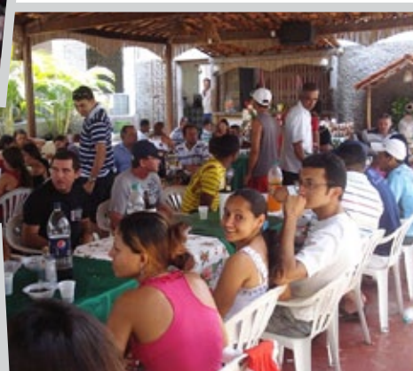
Confraternização em Russas/CE