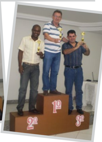
Primeiros colocados na Premiação de Valores